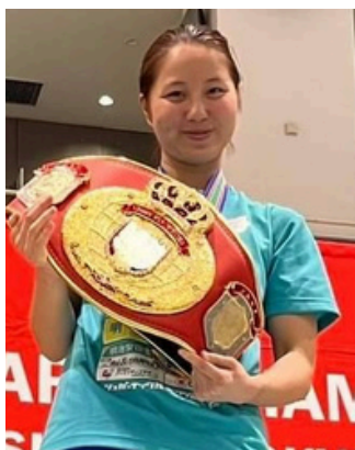
イタリア予選出場をかけた全日本選手権で優勝した際の写真